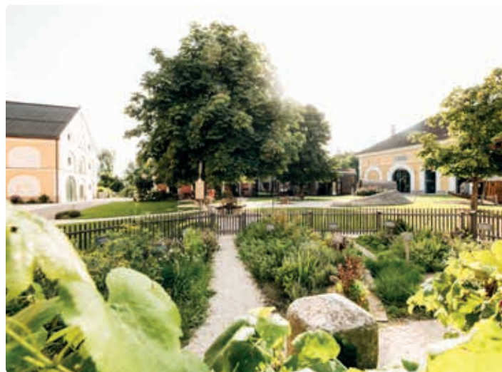
Kräutergarten im Biergut Wildshut.

ganzjährig für Erwachsene zu den Themen Brotwerkstatt, Brauwerkstatt, Kräuterwerkstatt, Führungen am Biergut mit Bierverskostung, Geführte Produktverkostung mit Bieren, Betriebsführungen, Yoga.