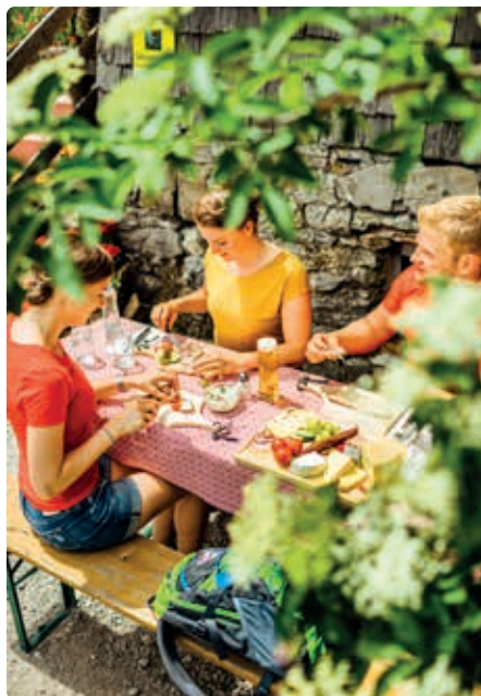
Jause auf der Mayerlehenhütte.

Mayerlehenhütte auf der Gruberalm www.gruberalm.at