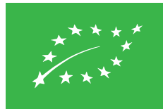
AT-BIO-402 Österreichische Landwirtschaft

Worauf Sie bei verpackten Bio-Produkten unbedingt achten sollten, ist das EU-Bio-Logo. Es ist verpflichtend auf allen in der EU produzierten Bio-Produkten angebracht und garantiert, dass das Produkt nach den Richtlinien der EU-Bio-Verordnungen 834/2007 und 889/2008 biologisch erzeugt wurde.