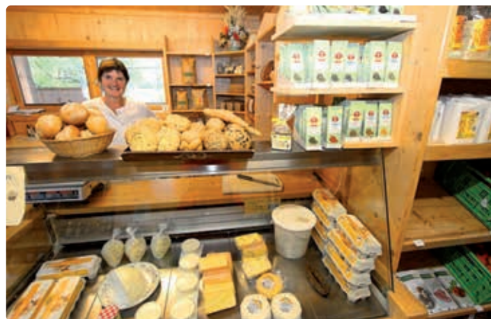
Hofladen Schafferbauer.