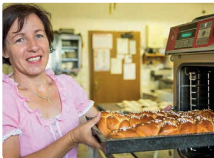
Produktion von Milchbrot beim Blasiwirt, St. Michael.