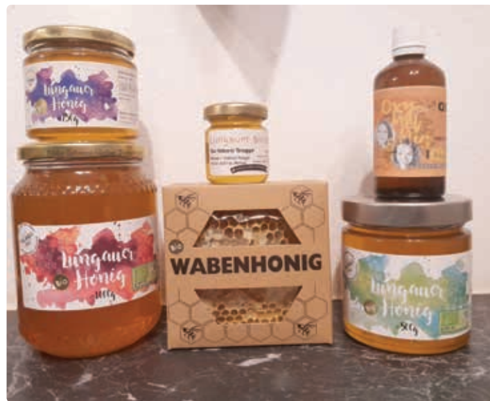
Honig-Produkte der Familie Brugger.

Johannisbeerlikör, Liköre - Honig-Propolis-Likör, Honig-Spiriturosen, Propolis, Blütenhonig, Cremehonig, Wabenhonig, Gänse 1x