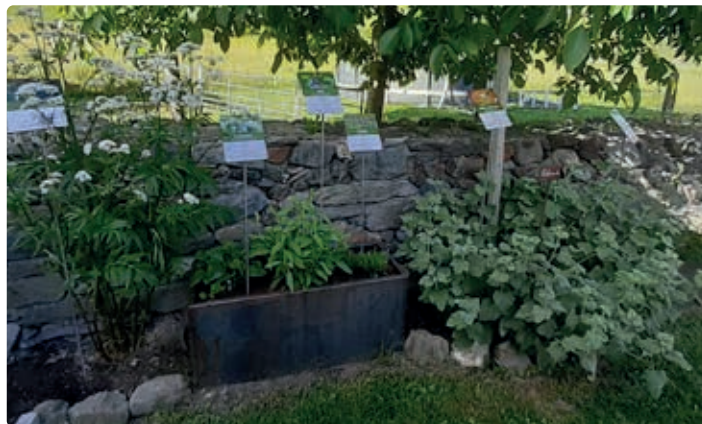
Kräutergarten vom Herzogbauer in Leogang.

Schaubauernhof - Führungen durch den Kräutergarten,