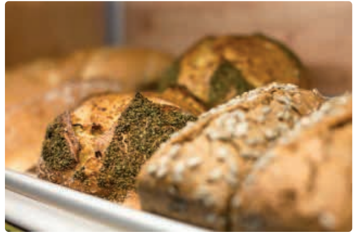
Brotangebot im Bioladen Seeham.