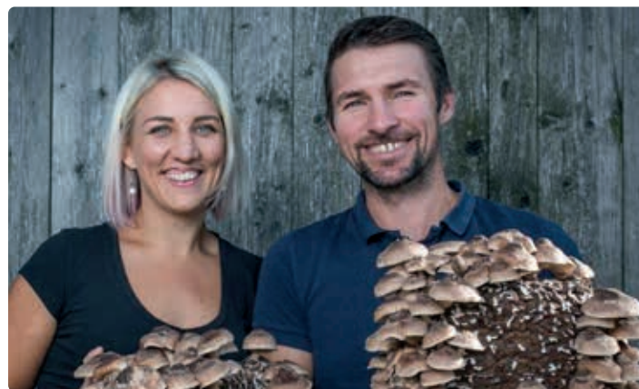
Flachgauer Biopilze.