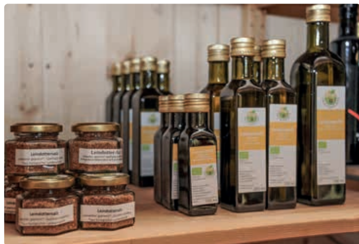
Biohof Sauschneider, St. Margarethen.

Schaubauernhof/Schule am Bauernhof: Betriebsführungen für Gruppen gegen Voranmeldung ganzjährig mit Verkostung, Die Grundlagen eines nachhaltigen Landbaus bis zum guten, gesunden Lebensmittel, Führung zum Getreideacker, die Bedeutung des Bodens als Grundlage der Fruchtbarkeit und Gesundheit. In der Backstube gibt Liesi Einblick in die handwerkliche Herstellung von Brot, abseits der industriellen Produktion und ihrer fragwürdigen