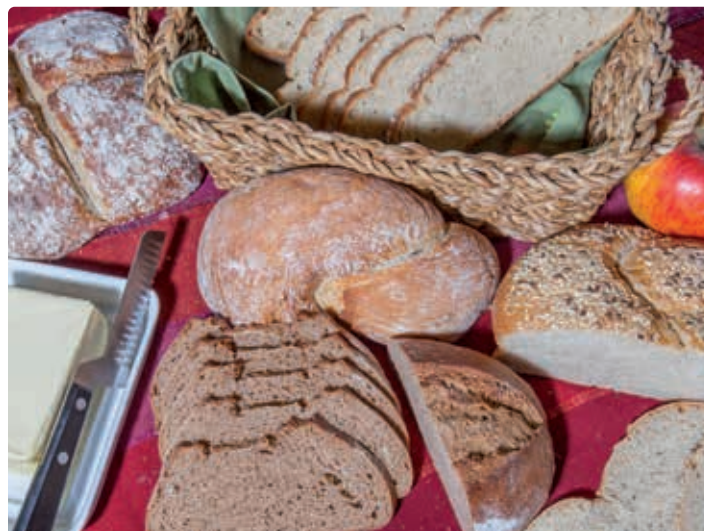
Brot aus Laufener Landweizen.