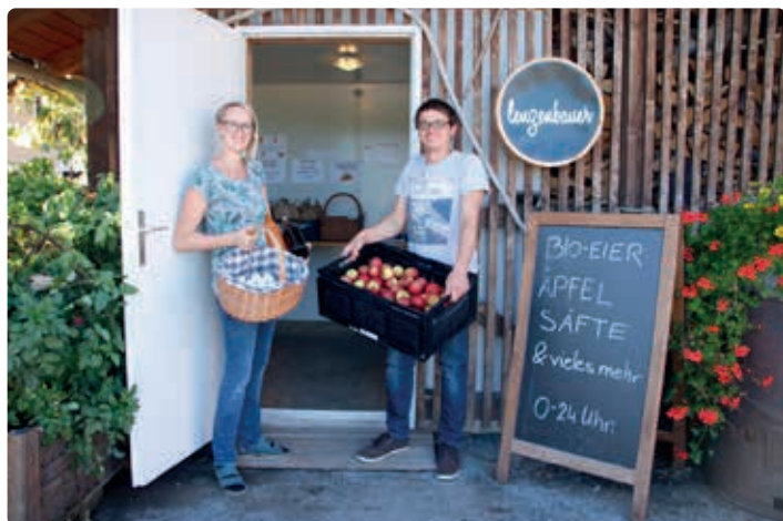
Hofladen beim Lenzenbauer in Hallwang.