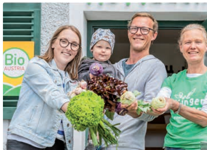
Fam. Klinger's Hofladen.

Helles Knödelbrot, Semmelbrösel, Vollkornbrösel, Vollkorn-Knödelbrot, Bauernbrot, Dinkel/Roggenbrot, Dinkelvollkornbrot, Mehrkornbrot, Milchbrot, Nussbrot, Roggenbrot,