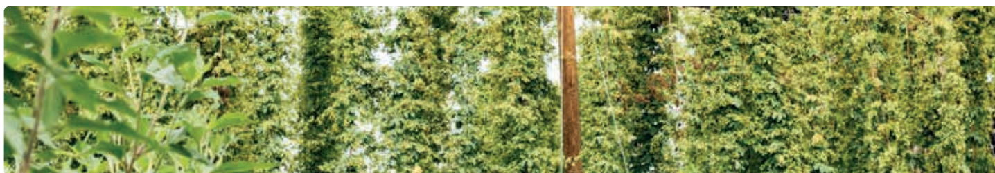
Hopfen beim Biergut Wildshut.