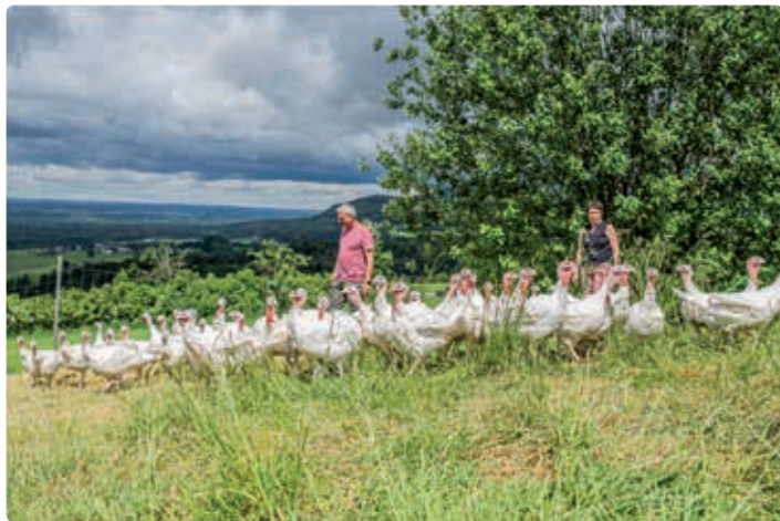
Puten am Seppengut.

Bergheim, Breitweg 4, Kirchgasser Susanne, Biohof Breit, 0664 5939430, s.kirchgasser@gmx.at,