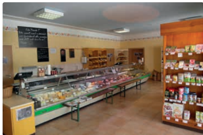
Hofladen des Joglbauern in Obertrum.

Geräucherte Fische, Fische - Fischfilets, Jostabeeren, Jungzwiebeln, Bataviasalat, Bolognesersalat, Eichblattsalat, Chili, Kuchchen, Petersilie, Cremehonig, Akazienhonig, Blütenhonig, Knödel, Kaspressknödel, Strudeln, Dinkel-Teigwaren, Frischkäse aus Kuhmilch, Himbeeren, Holunderbeeren, Forelle, Saibling, Käsekrainer, Roggenbrot, Helle Teigwaren, Rote Johannisbeeren, Vollmilchtopfen, Zwetschkenmarmelade, Mehrfruchtarmelade, Wirtschaftsobst, Goldparmäne, Topaz, Brombeeren, Joghurt, Roggen, Dinkel-Feinmehl, Dinkel-Vollmehl, Schnittlauch, Roggenschrot, Apelessig - und Birnenessig, Kräuternessig - und Blütenessige, Zwetschken, Erdbeermarmelade, Weintrauben, schwarze Johannisbeeren, Marillen, Kirschenmarmelade, Brombeermarmelade, Dinkelvollkornbrot, Dinkelgebäck, Molke, Eibisch, Lindenblütenhonig, Sonnenblumenhonig, Kräuterpesto, Suppenhühner - 1x jährlich aus Eigenproduktion, Zuckerhut, Zwiebeln, Vogerlsalat, Tomaten, Speisekürbis, Chinakohl, Sauerrahm, Magermilch, Buttermilch, Heumilch - Weidemilch, Schweinefleisch - 2x jährlich aus Eigenproduktion, Holunderlikör, Zwetschkenbrand, Birnenmost, Birnenbrand, Hühnereier, Apfelsaft, Apfelmilch, Bratwürste, Salami, Gurken, Pressobst, Zucchini, Gartenkräuter, Emmentaler, Kirschen, Marillenmarmelade, Walnüsse ganz, Holunderbeermarmelade, Dinkel, Topfen, Kohl, alte Apfelsorten, Endiviensalat, Kronprinz Rudolf, Sauerkrautsaft, Frankfurter, Birnen, Essiggurken, Weißkraut, Bleichspargel, Fisolen, Klarapfel, Jonagold, Torten,