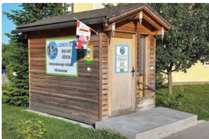
Selbstbedienungshütte beim Göschl.

St. Pantaleon, Pichling 1, Kinzl Kathrin u. Karl, Biohof Pichler, 0664 73489558, 0664 3929558, kathrin.kinzl@gmx.at,