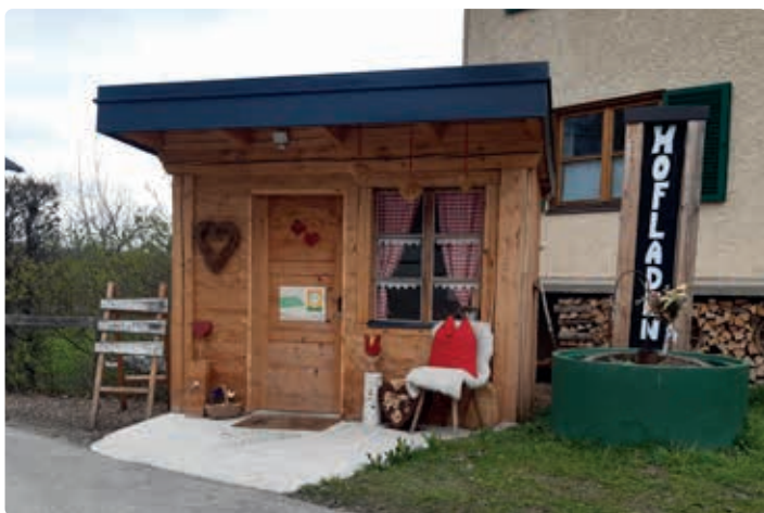
Selbstbedienungshütte.