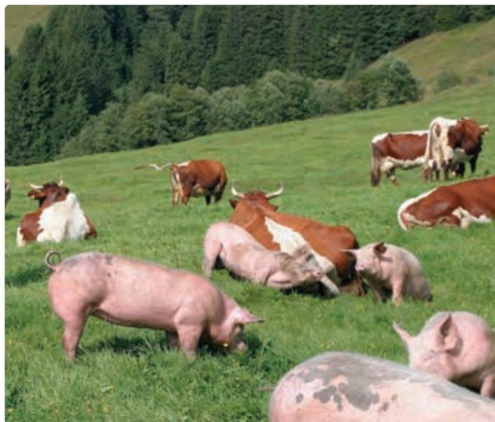
Weidegang am Betrieb Scharlern.

Verkauf im Saalachtaler Bauernladen in Lofererstraße 26, Saalfelden Dienstag, Mittwoch, Donnerstag, Freitag und Samstag von 08:30 bis 12:00 Uhr, Freitag 14:00 bis 18:00 Uhr.