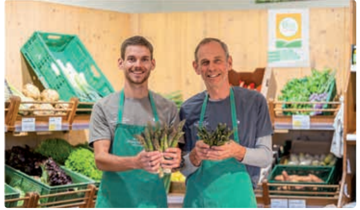
Familie Spitzauer vom Bio-Bauernmarkt Aglassing.

Schaubauernhof - ganzjährig nach Vereinbarung, Exkursionsbetrieb für LWS, Studenten, Landwirte, Konsumenten, LWS, Bodenpraktiker, Werklehrerin, Betriebsführungen - Kreislaufwirtschaft, Boden, Alte Sorten, Direktvermarktung, Hofladen mit Vollsortiment, artgerechte Tierhaltung