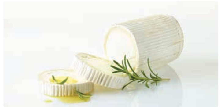
Bio-Produkt Ziegenkäse.

Bauernladen Schwarzach Dienstag/Freitag 8:30-17:00 Uhr