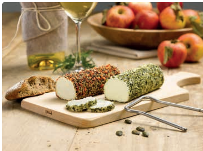
Wolfgangsee Schafkäse.