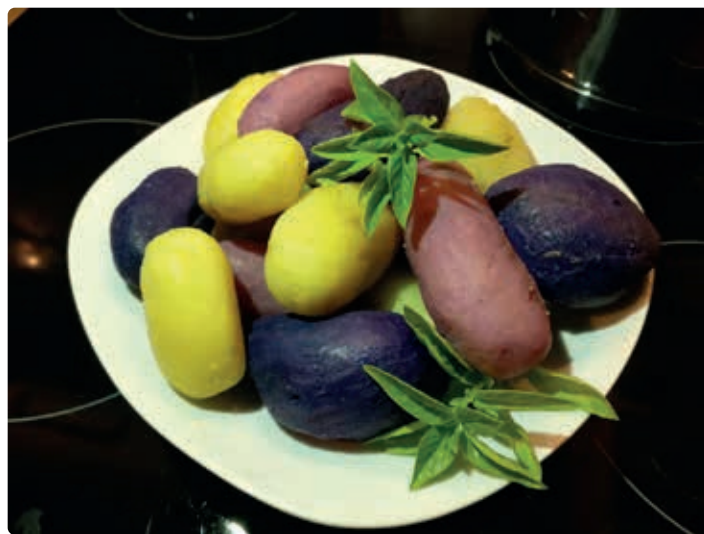
Lungauer Eachtling-Vielfalt.