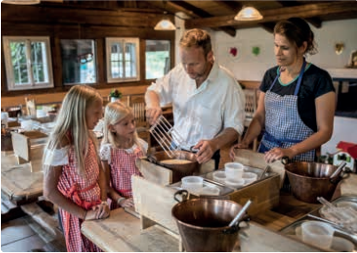
Käse machen am Fürstenhof in Kuchl.