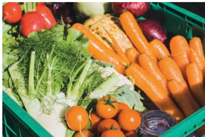
Gemüsebox vom Hintermanngül.