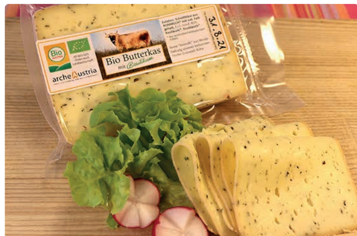
Bio-Butterkäse mit Basilikum.

Dinkelbrot, Roggen, Dinkel, Dinkel-Vollmehl, Dinkel-Feinmehl, Roggen-Vollmehl, Bauernbrot, Dinkelvollkornbrot, Roggenbrot, Dinkelgebäck, Butterkäse, Bergkäse, Blütenhonig, Cremehonig, Waldhonig, Schweinefleisch - 3x jährlich im Mischpaket und küchenfertig zerlegt, Dinkel, Roggen, Dinkel/Roggenbrot, Hausbrot, Roggenvollkornbrot, Vollkornbrot, Gebäck mit Ölsaaten, Heumilch, Rohmilch, Rindfleisch - alle 3 Monate im