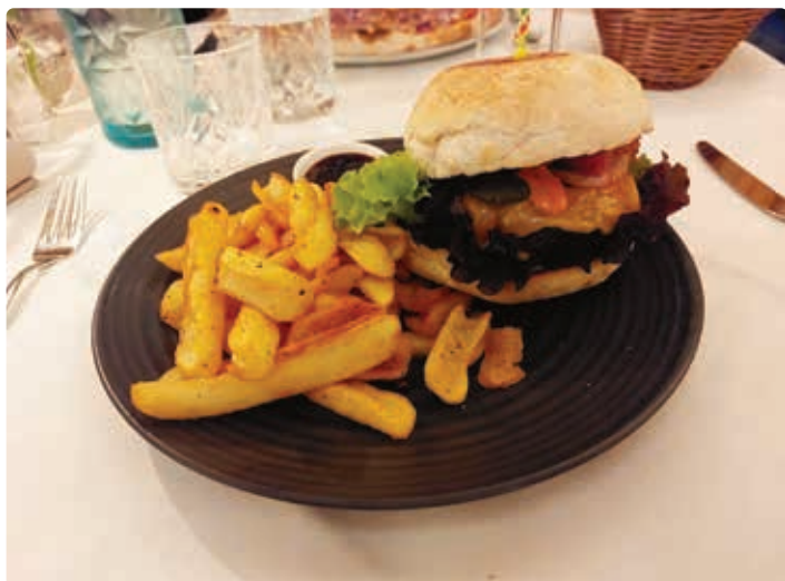
Produktfoto Hochkönig Wagyu.

info@hochkoenig-wagyu.at , https://www.hochkoenig-wagyu.at ,