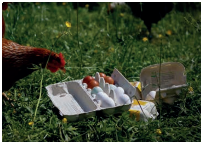
Hühner & Eier vom Jagglhof.