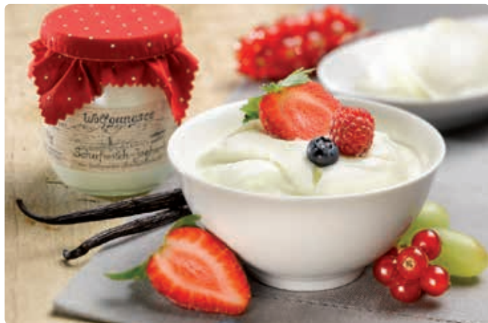
Eisl Schafmilchprodukte.

in der Getreidegasse 22 in Salzburg, geöffnet in den Sommermonaten