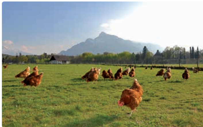
Hühnerweide am Erentrudishof.

Vollsortiment im angeschlossenen Nonnberger Erentrudishof- Hofladen, Tel. 0662 822858