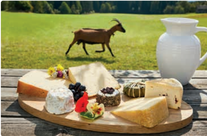
Käseplatte Hiasnhof, Göriach.

„Lungauer Spezialitätenladen - Kemmts eina“ am Marktplatz 7 in Tamsweg. Montag-Freitag 9-12 Uhr, 14-18 Uhr, Samstag 9-12 Uhr