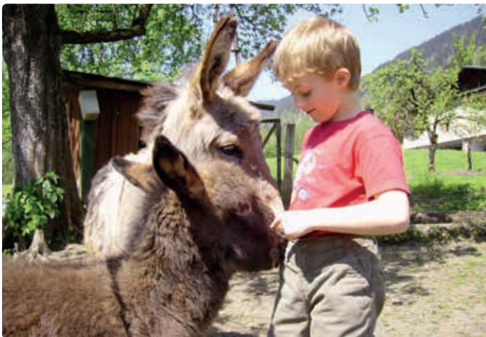
Schule am Bauernhof Angebot.