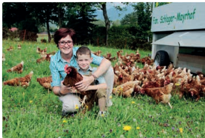
Legehühner.