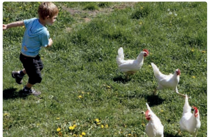
Betrieb Rohrmoser, Reiterhof.

für bis zu 25 Kinder oder 15 Erwachsene, Übernachtung möglich, mit teilweise Biologischer Verpflegung