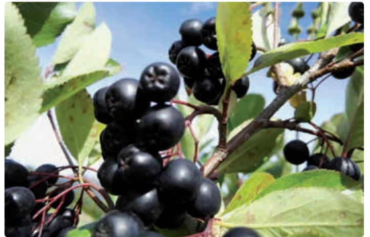
Aroniabeeren vom Zehnerhof.