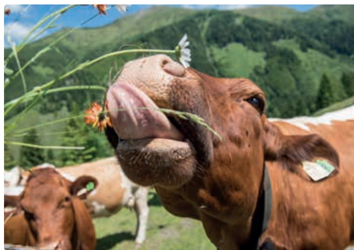
Familie Pirchner, Salchegg in Rauris.

RegioBox.Raurisertal, Sportstraße 1, Rauris rund um die Uhr