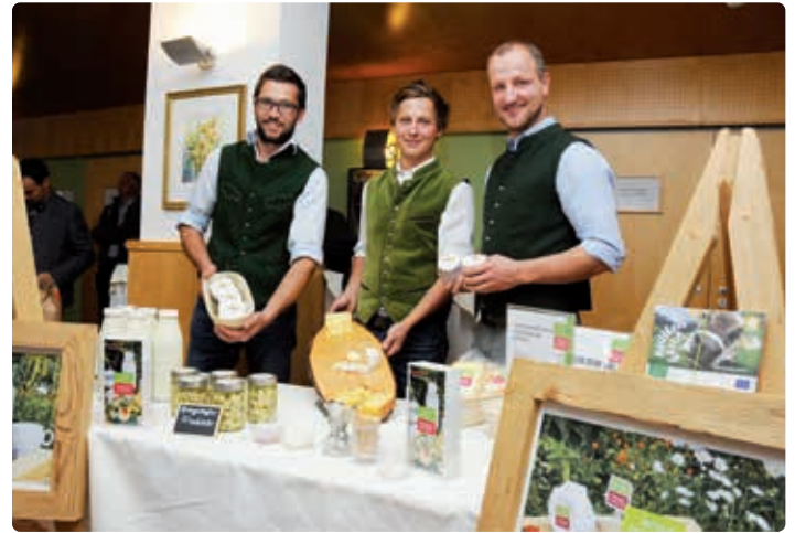
Bio aus dem Tal.

Geschenkboxen/körbe - Geschenkkörberl klein um 40 Euro mit Bio-Produkten: 5 verschiedenen Käsesorten, Hauswürste, Tee, Honig, Produkte: Kräuterkäse, Pfefferkäse - und Bockshornkleekäse, Weichkäse, Camembert, Weichkäse in Öl, Butterkäse, Almkäse, Hauswürstel, Käsekrainer, Salami, Hühnereier, Kalbinnenfleisch - laufend im Mischpaket und küchenfertig zerlegt, Ochsenfleisch - laufend im Mischpaket und küchenfertig zerlegt, Rindfleisch - laufend im Mischpaket und küchenfertig zerlegt, Kalbfleisch - im Mischpaket und küchenfertig zerlegt, Schweinefleisch - im Misch-