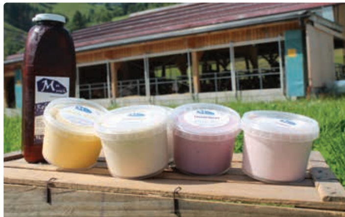
Milchprodukte Zieferhof.

Dinkel, Roggen, Dinkelreis, Dinkel-Vollmehl, Roggen-Vollmehl, Vollkorn-Teigwaren, Dinkelvollkornbrot, Frühkartoffeln, fest- kochende/mehlige/vorwiegend festkochende Lagerkartoffeln, Kuhmilch, Rohmilch, Buttermilch, Fruchtjoghurt, Joghurt, Sauer- milch, Topfen, Vollmilchtopfen, Sauerrahmbutter, Ochsenfleisch - 3-4x jährlich