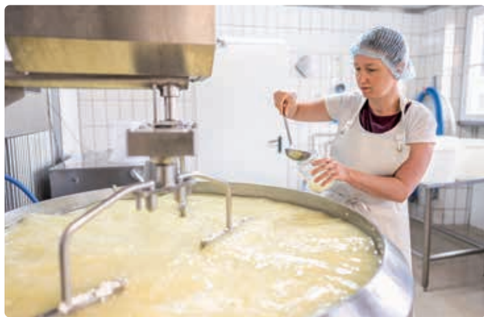
Käseproduktion beim Samshofbauern.

Oberndorf, Loipferdingerstraße 6, Bruckmoser, Biohof Schmuck, 06272 7678, 0677 63683892, hallo@schmuckbauer.bio, http://www.schmuckbauer.bio ,